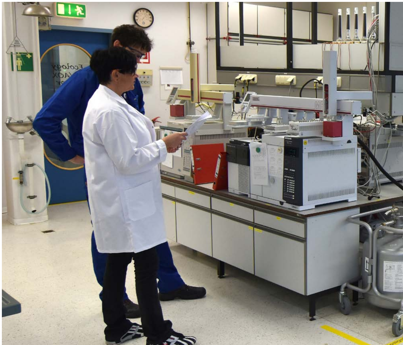
Das GC-Labor des Ecology Labors von Dow in Stade spiegelt in puncto Automatisierung eine große Affinität zu GERSTEL-Lösungen wider.